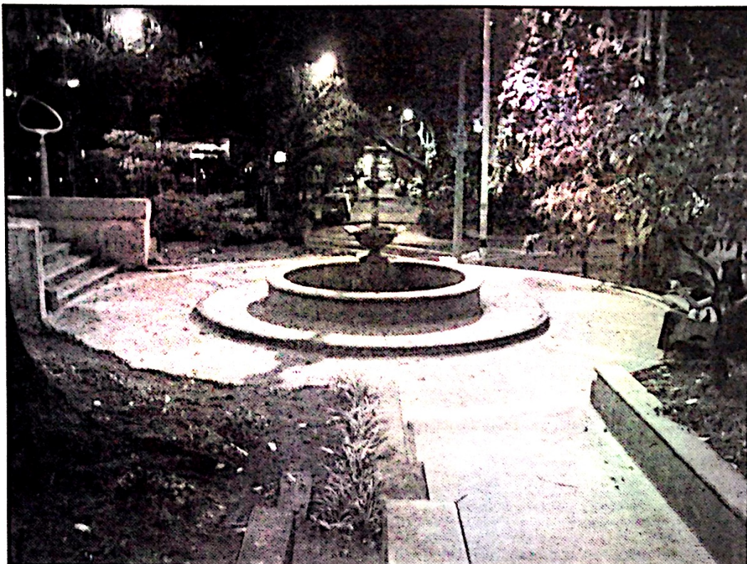
Parque Lleras

La Corporación Zona Rosa, creada con el objetivo de recuperar los