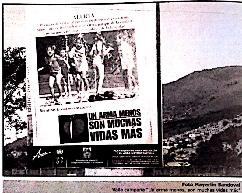
Valla campaña "Un arma menos, son muchas vidas más"

Nuestra labor es hacerle un seguimiento individual, familiar y social a cada desarmado, e involucrarlos en los proyectos que tenemos para ellos. Uno de estos