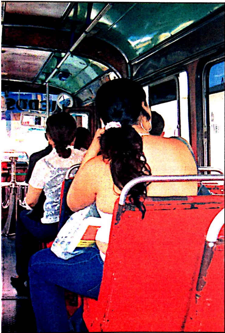
Ruta 097, Buenos Aires