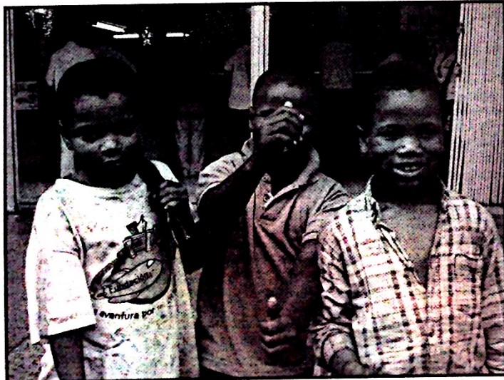
Centro de Medellín

No es de extrañar que blancos y negros que han soportado atropellos aberrantes a sus derechos humanos, construyan su propio mundo; sean el verdadero gobierno del pueblo y aunque no tengan saco, corbata o fajos de billetes, cuenten con ideas como la más contundente de las armas y desde la construcción de organizaciones sociales, poco a poco autodeterminen su propio destino social.