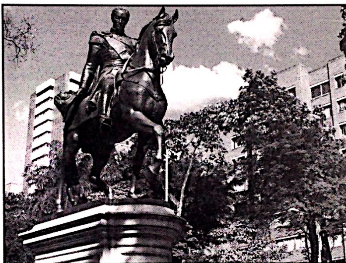
Parque Bolívar