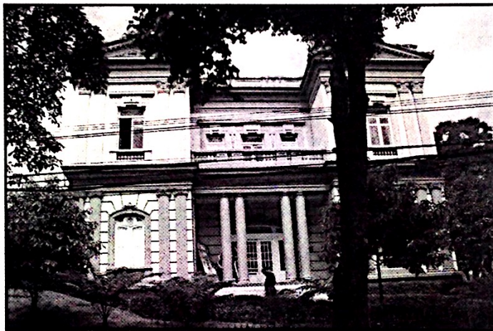
Teatro del Águila Descalza. Prado Centro

tango, a montar "Tanto Tango", a embebernos con el tango. Ella trabajaba en el instituto de integración cultural de Quirama. Hicieron un recorte de personal. Le entregaron su liquidación 45.000 pesos. Con esa plata alquilamos una casa en el primer parque de Laureles que valía 45.000 pesos. Era una locura. Porque meterle toda la liquidación a un mes era tenaz. Pero lograron su cometido de salir adelante.