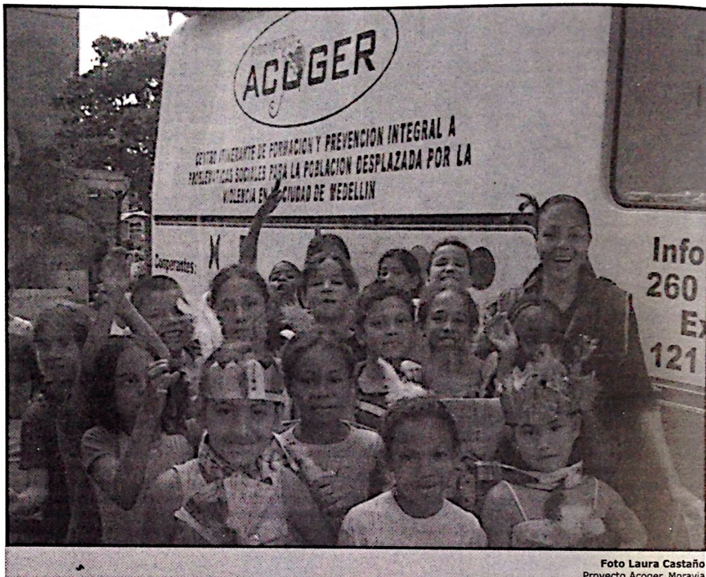
Proyecto Acoger, Moravia

De esta manera, el desarrollo de estos proyectos busca mejorar la calidad de vida de los desplazados, y en especial de los niños y adolescentes, además de prevenir la aparición de las problemáticas sociales, tales como el consumo y abuso de drogas, el maltrato infantil, la violencia intrafamiliar, el abuso sexual, el embarazo temprano en