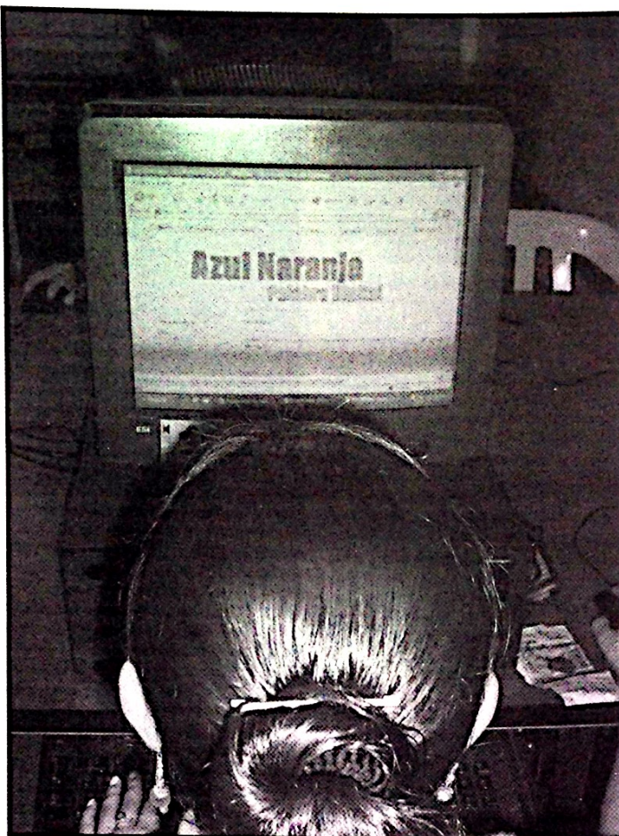
Foto Mayerlín Sandoval Sala de Redacción Periódico Virtual Azul Naranja

Sin embargo, para acceder a esta nueva modalidad periodística al igual que todas se requieren ciertas