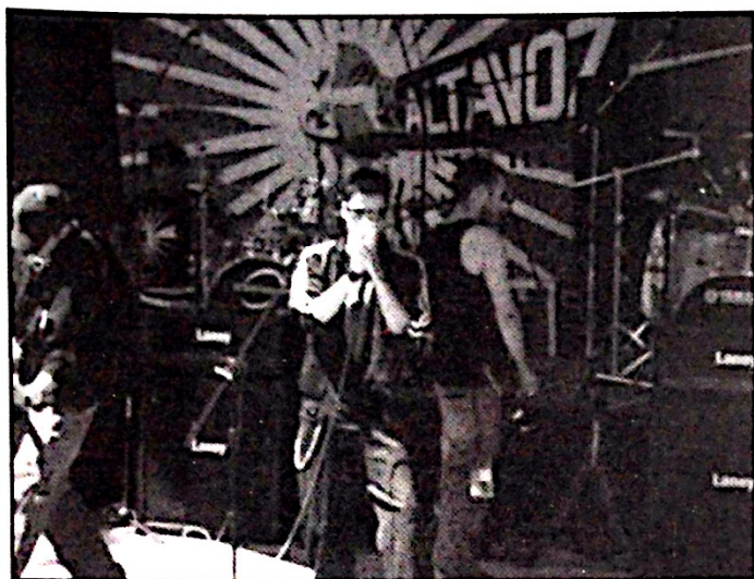
Concierto eliminatorio Altavoz