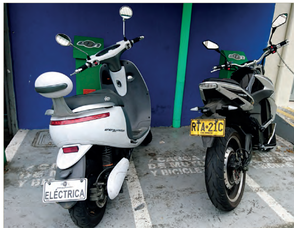
Estación de recarga para vehículos eléctricos.

En un plazo no superior a seis meses, el Runt y los Centros de Diagnóstico Automotor deberán actualizar, habilitar las tablas de parametrización, procedimientos para poder llevar un proceso de estos nuevos vehículos que entraran hacer inspeccionados en la revisión técnico mecánica.