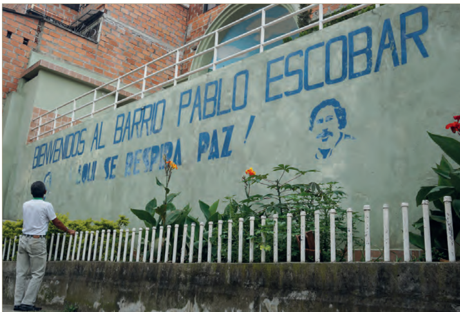
Barrio Pablo Escobar, Medellín Antioquia