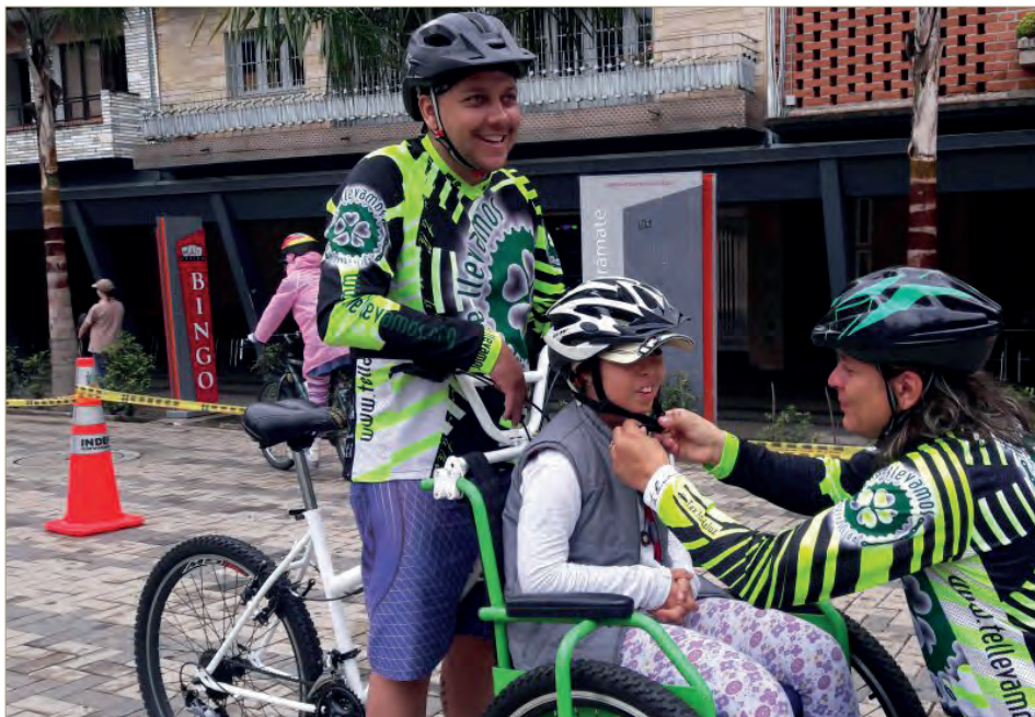
Jornada de pedalear por la inclusión.

Daniela Tabares Bedoya - daniela.tabaresbe@amigo.edu.co