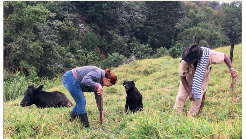
Remplazó su arma por una palilla para sembrar.