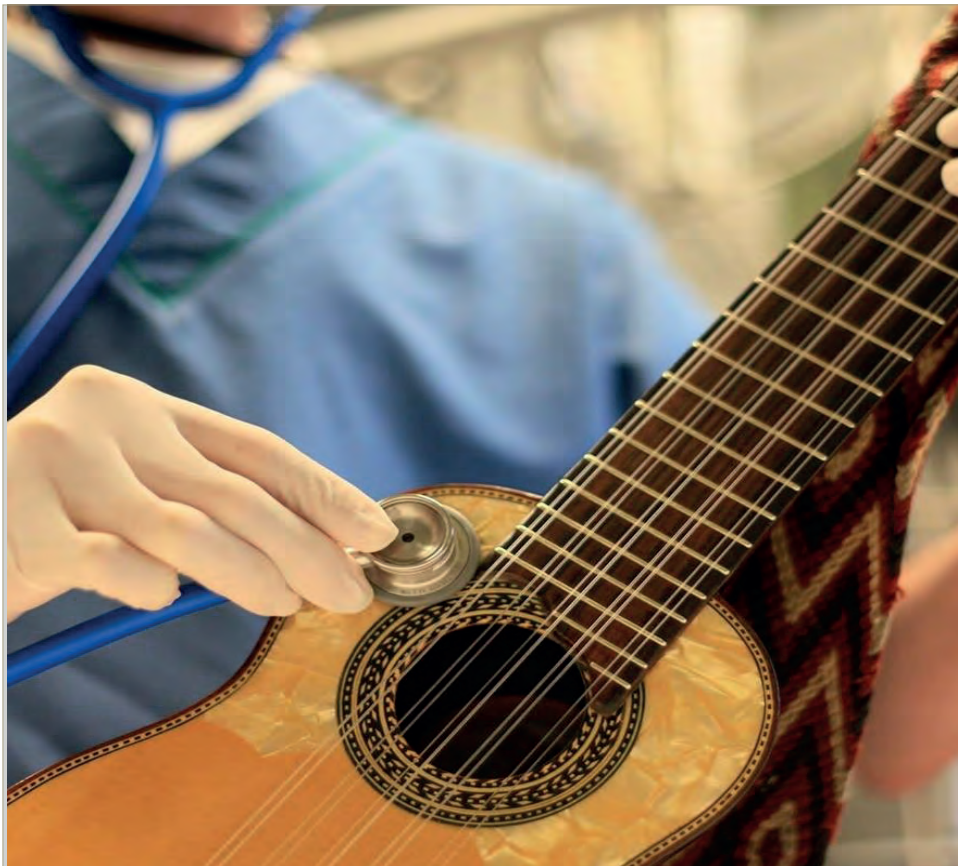
La musicoterapia, un avance desde la medicina, rehabilita y ayuda al crecimiento personal del paciente.