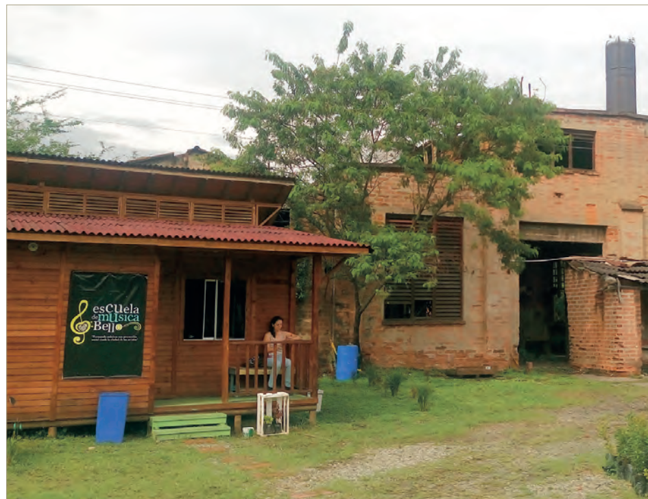
Antigua estación Bello del Ferrocarril de Antioquia.