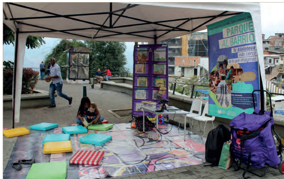
Actividad Libro Móvil - Foto tomada por: Johana Vallejo Alzate

Parque al Barrio es un reflejo de lo anterior. Es, además, el proyecto que trabaja con y para la comunidad pensando en el futuro de la Comuna Uno de Medellín y, donde se recuperan hábitos de cultura mediante el mecanismo de “llevar la biblioteca a la calle, a las gentes”.