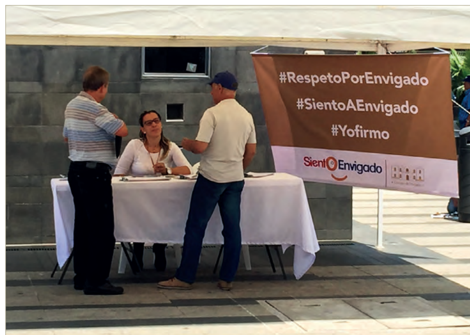
Envigadeños firman por el respeto.

Maya Salazar concluye que el contexto social incide mucho en la percepción, por lo tanto el narcotráfico y las bandas delictivas son asuntos que, tienen el carácter de la ubicuidad, es decir, se puede dar en cualquier región del país, lo que no se debe permitir es asociar al territorio con estos fenómenos, porque allí está el irrespeto.