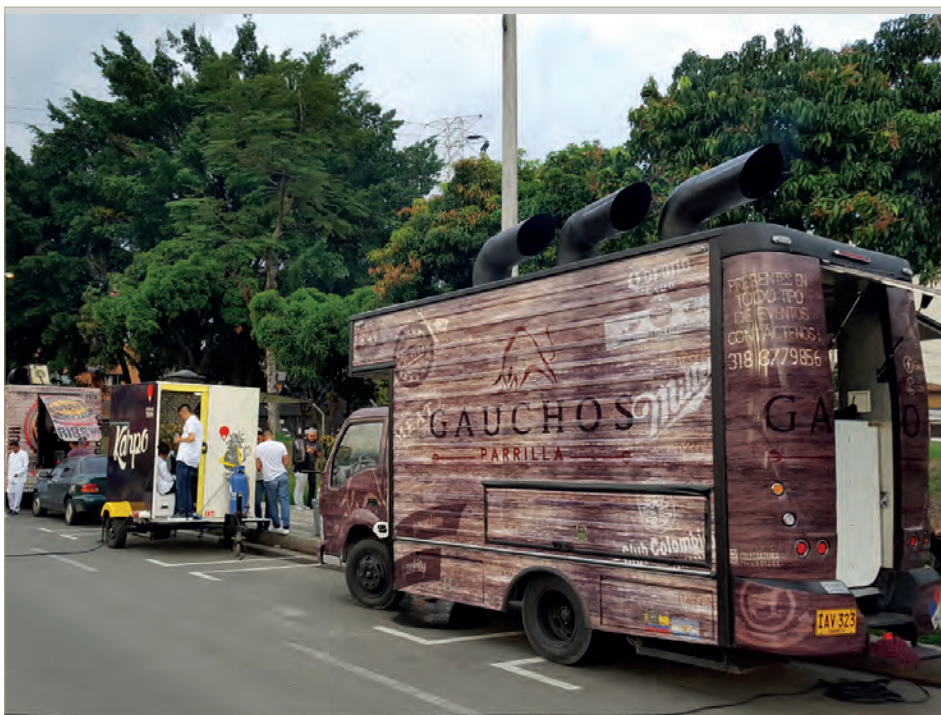
Food Trucks en Medellín.

El 24 de agosto, el Concejo de Medellín, instaló la Comisión accidental N°186 de 2016, para estudiar y discutir las diferentes implicaciones que tiene el aumento del número de Food Trucks y vehículos Tuk Tuk en la ciudad. A la fecha el documento técnico de soporte y desarrollo del componente físico espacial, que son elementos fundamentales para el desarrollo de la norma, se encuentra en construcción por lo que se espera seguir avanzando en el proceso para el presente año.